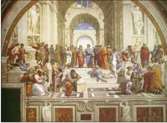
Ραφαήλ, Η Σχολή των Αθηνών