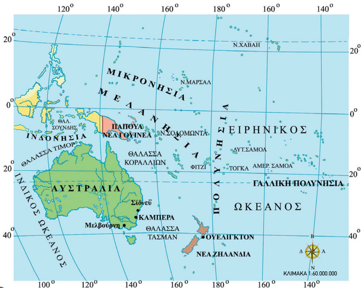
Εικόνα 45.1: Πολιτικός χάρτης της Ωκεανίας