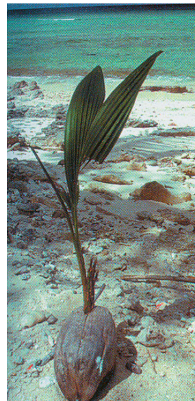
Εικόνα 44.7: Βλαστάρι καρύδας, Μικρονησία