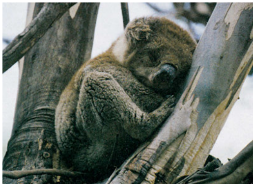
Εικόνα 44.5: Το κοάλα

Όπως έχουμε μάθει, ανάλογα με τα είδη των φυτών μιας περιοχής αναπτύσσονται και τα είδη των ζώων που ζουν σε αυτήν. Ας συζητήσουμε για την ποικιλία της πανίδας που θα συναντήσουμε στις περιοχές της Ωκεανίας.