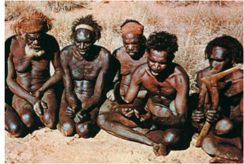
Εικόνα 45.4: Αβορίγινες

Ας συζητήσουμε τώρα μαζί για την επίδραση που δέχονται τα πολιτιστικά στοιχεία (ήθη, έθιμα, μουσική, μαγειρική κ.ά.) από τη συμβίωση των λαών.