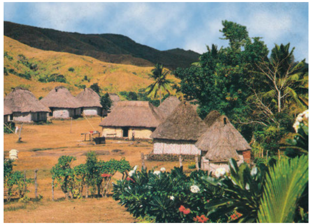
Εικόνα 45.3: Καλύβες ιθαγενών στα Φίτζι της Μελανησίας

Ανάλογη οικονομική ευρωστία παρουσιάζει και η Νέα Ζηλανδία, η οποία πραγματοποιεί μεγάλες εξαγωγές κρέατος σχεδόν σε όλο τον κόσμο και έχει εξασφαλίσει αξιόλογο επίπεδο ζωής για τους κατοίκους της.