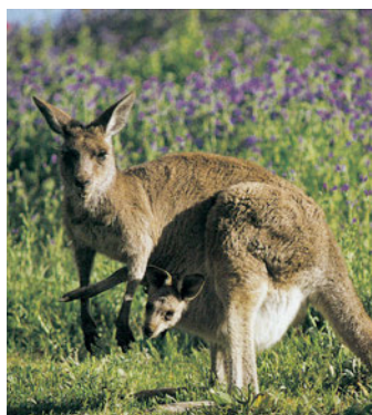
Εικόνα 44.6: Το καγκουρό