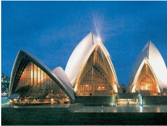
Εικόνα 45.2: Η όπερα του Σίδνεϋ

Συζητήστε πώς κατόρθωσε η Αυστραλία να αναπτυχθεί τόσο πολύ, ενώ ανεξαρτητοποιήθηκε από τη Μ. Βρετανία μόλις στις αρχές του προηγούμενου αιώνα.