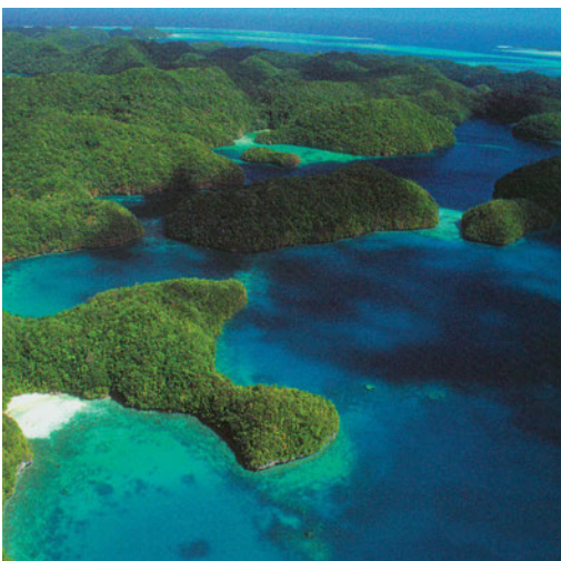
Εικόνα 44.2: Παλάου, Μικρονησία

Ας εξετάσουμε μαζί το υδρογραφικό δίκτυο της Αυστραλίας. Το ποτάμιο σύστημά της αποτελείται κυρίως από τους ποταμούς Μάρεϊ και Ντάρλινγκ. Ας μελετήσουμε τον ρόλο του ανάγλυφου της Αυστραλίας στη δημιουργία αυτού του ποτάμιου συστήματος.