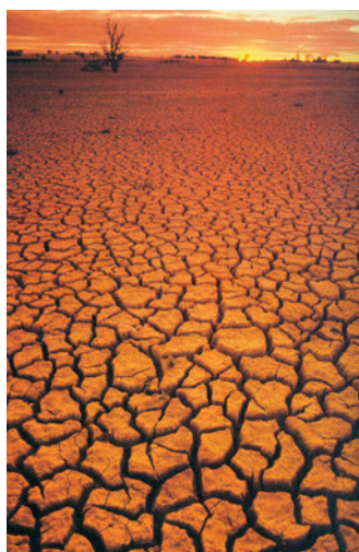
Εικόνα 44.3: Άγωνα έκταση στο εσωτερικό της Αυστραλίας