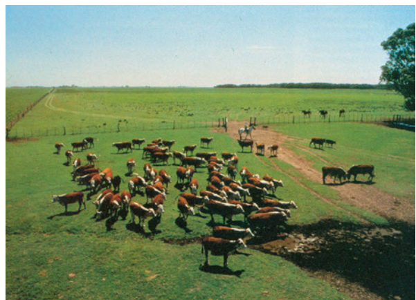
Εικόνα 42.3: Βοοειδή στα πάμπας της Αργεντινής

Ο Αμαζόνιος έχει μικρότερο μήκος από τον Νείλο, αλλά ο όγκος του νερού που μεταφέρει στη θάλασσα είναι μεγαλύτερος από τον όγκο του νερού που μεταφέρουν ο Νείλος και ο Μισισσιπής μαζί. Λέγεται μάλιστα ότι αυτός μόνος του περιέχει το 20% του γλυκού νερού του πλανήτη. Ο Αμαζόνιος με τους παραποτάμους του δημιουργεί ένα πλωτό δίκτυο 80.000 χιλιομέτρων. Στις εκβολές του σχηματίζεται ένα τεράστιο «δέλτα», το οποίο περιέχει ολόκληρο νησί, το Μαρέχο, με έκταση όση είναι η έκταση της Δανίας.