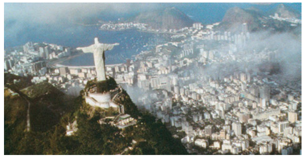
Εικόνα 43.5: Ρίο ντε Τζανέιρο, Βραζιλία

Κατά τον 19ο αιώνα, μετά τη Γαλλική Επανάσταση και τη Διακήρυξη των Δικαιωμάτων του Ανθρώπου, άρχισαν να ξεσπούν στα εδάφη της Νότιας Αμερικής επαναστάσεις για την απελευθέρωση των ντόπιων κατοίκων από τους αποικιοκράτες Ισπανούς. Σύμβολο του αγώνα για την ανεξαρτησία των βόρειων περιοχών ήταν ο Σιμόν Μπολιβάρ, αξιωματούχος γνωστός ως απελευθερωτής.