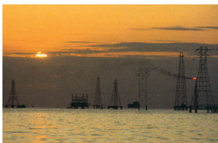
Εικόνα 43.6: Πύργοι γεώτρησης πετρελαίου στη λιμνοθάλασσα Μαρακαϊμπο

Βενεζουέλα ανήκει επίσης στα ανεπτυγμένα κράτη της Νότιας Αμερικής, καθώς σε αυτή υπάρχουν μεγάλα κοιτάσματα πετρελαίου που εξάγεται σε όλες τις χώρες του κόσμου. Μάλιστα στην περιοχή της λιμνοθάλασσας του Μαρακαϊμπο λειτουργούν πολλά διυλιστήρια. Η Κολομβία βρίσκεται ανάμεσα στις πρώτες χώρες παραγωγής καφέ παγκοσμίως. Ακολουθούν η Χιλή με τα πλούσια κοιτάσματα σιδήρου και χαλκού και το Περού με τα πολλά ορυχεία χρυσού, αργύρου, χαλκού, μολύβδου και σπάνιων μετάλλων.