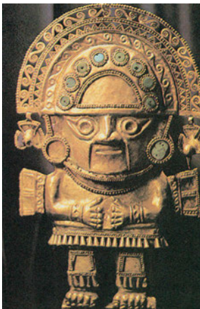
Εικόνα 43.1: Χρυσό ειδώλιο από τον πολιτισμό των Ίνκας