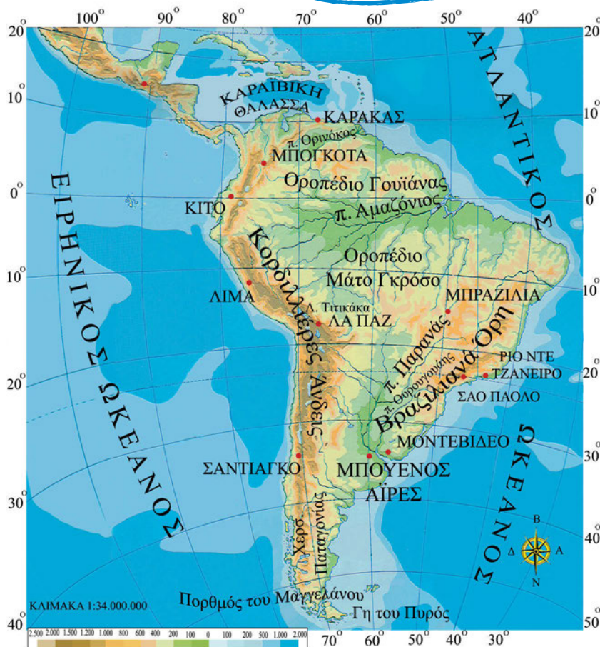
Εικόνα 42.1: Γεωμορφολογικός χάρτης της Νότιας Αμερικής