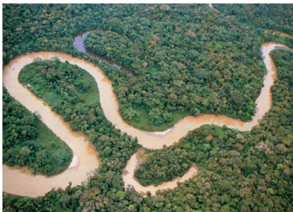
Εικόνα 42.2: Ζούγκλα Αμαζονίου

Ας συζητήσουμε μαζί για τα προβλήματα που προκαλεί στον πλανήτη μας η αλόγιστη εκμετάλλευση των δασών της Αμαζονίας.