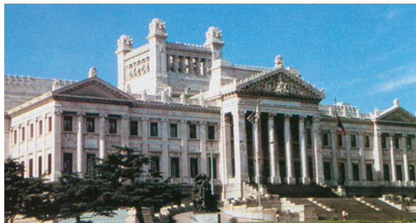
Εικόνα 43.4: Κοινοβούλιο του Μοντεβιδέο, Ουρουγουάη

Βρείτε στον χάρτη της τάξης τα κράτη της Νότιας Αμερικής και ονομάστε την πρωτεύουσα κάθε κράτους. Ποια από τα κράτη αυτά ωφελούνται από τη ροή του Αμαζονίου;