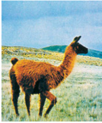
Εικόνα 42.4: Λάμα.