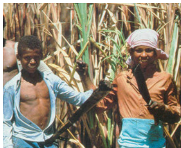
Εικόνα 43.7: Βραζιλία, καλλιεργητές ζαχαροκάλαμου