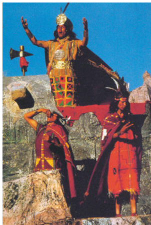
Εικόνα 43.2: Ινδιάνοι του Περού στη γιορτή του Ήλιου