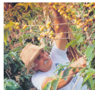
Εικόνα 43.8: Σάο Πάολο, συγκομιδή καφέ

Ας συζητήσουμε τους λόγους για τους οποίους πολλά από τα κράτη της Νότιας Αμερικής μαστίζονται από τη φτώχεια. Τι προτείνουμε να αλλάξει, για να μπορέσουν να αναπτυχθούν και αυτά;