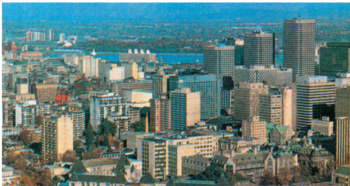
Εικόνα 40.3: Μόντρεαλ, Καναδάς

Συζητήστε τον τρόπο αντιμετώπισης των ινδιάνων από τους Ευρωπαίους αποίκους. Πιστεύετε ότι ήταν σωστός; Κατά τη δική σας άποψη ήταν δυνατή η συμβίωση των ινδιάνων με τους Ευρωπαίους; Τι οφέλη θα μπορούσε να έχει η ανθρωπότητα από μια τέτοια συμβίωση;