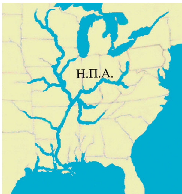
Εικόνα 39.2: Δίκτυο Μισούρι – Μισισιπή

Το υδρογραφικό δίκτυο της Βόρειας Αμερικής συμπληρώνεται και από τεχνητά κανάλια που ενώνουν τις λίμνες που υπάρχουν στο βόρειο τμήμα της. Οι λίμνες, τα κανάλια και ο ποταμός του Αγίου Λαυρεντίου διαμορφώνουν ένα ιδιαίτερα χρήσιμο πλωτό ποτάμιο σύστημα, που συνδέει το εσωτερικό της ηπείρου με τον Ατλαντικό Ωκεανό.