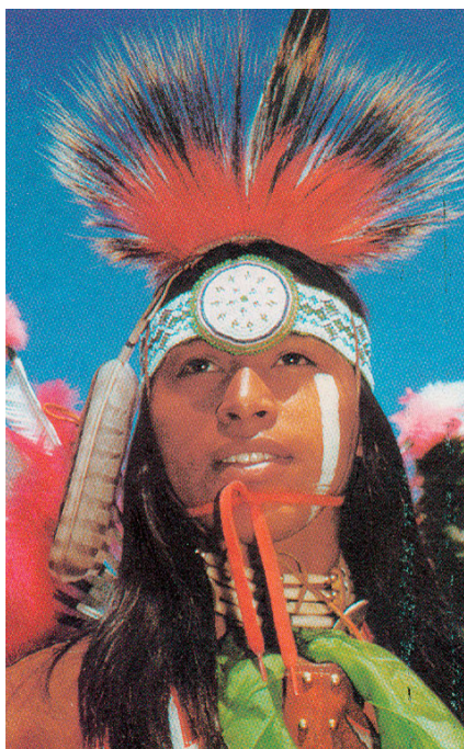
Εικόνα 40.1: Ινδιάνος των Πεδιάδων, Ηνωμένες Πολιτείες