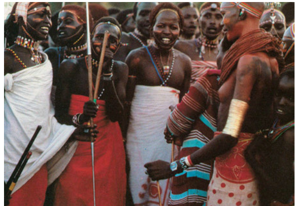
Εικόνα 38.2: Οι φυλές Κικουγιού και Μασάι της Κένυας

Ας συζητήσουμε μαζί γιατί στην Αφρική συναντάμε τόσο μεγάλη ποικιλία εθίμων, συνθειών και πολιτισμών, στοιχεία τα οποία τη χαρακτηρίζουν ως «μωσαϊκό φυλών και εθνοτήτων».