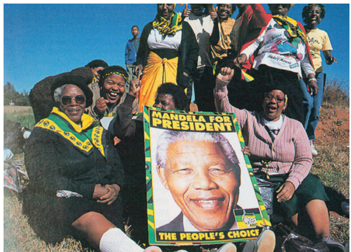
Εικόνα 38.6: Νέλσον Μαντέλα

Σήμερα η Αφρική αποτελείται από περισσότερα από 55 κράτη, πολλά από τα οποία απέκτησαν την ανεξαρτησία τους κατά τις τελευταίες δεκαετίες. Τα κράτη κυρίως της Κεντρικής Αφρικής είναι αραιοκατοικημένα εξαιτίας των δύσκολων κλιματικών συνθηκών που επικρατούν εκεί.