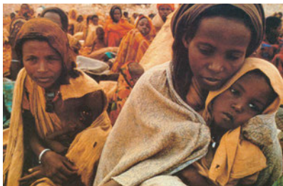
Εικόνα 38.3: Καταυλισμός προσφύγων της Σομαλίας