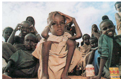
Εικόνα 38.4: Λιμός στη Σομαλία