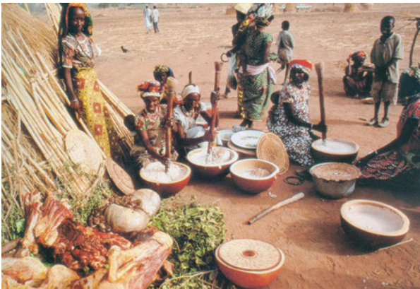
Εικόνα 38.1: Νομάδες στο Φουλάνι Δυτ. Αφρικής