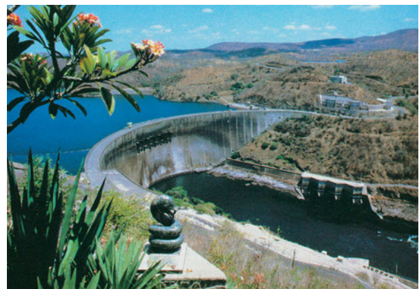
Εικόνα 37.3: Το φράγμα στον Ζαμβέζη, Ζιμπάμπουε

Το υδρογραφικό δίκτυο της Αφρικής αποτελείται από πολλές μεγάλες λίμνες, όπως είναι η Βικτόρια, η Ταγκανίκα, η Νυάσσα, η Τσαντ και άλλες, καθώς επίσης και από γνωστούς ποταμούς.