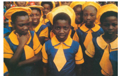
Εικόνα 38.5: Στο σχολείο του Λάγος της Νιγηρίας

Στην Κεντρική Αφρική κυρίως κατοικούν μαύροι ιθαγενείς, οι οποίοι δέχθηκαν έντονες επιρροές από την αποικιοκρατία των Ευρωπαίων και από την εγκατάσταση των Αράβων στην περιοχή. Πολλές από τις χώρες της Κεντρικής Αφρικής ανήκουν σε αυτές που ονομάζουμε «χώρες του Τρίτου Κόσμου», επειδή είναι οι πιο φτωχές του κόσμου. Πείνα, αρρώστιες, ιδιαίτερα το Α.Ι.Δ.Σ., έλλειψη νερού και φαρμάκων οδηγούν τους κατοίκους σε αφανισμό, παρά τον μεγάλο αριθμό των γεννήσεων.