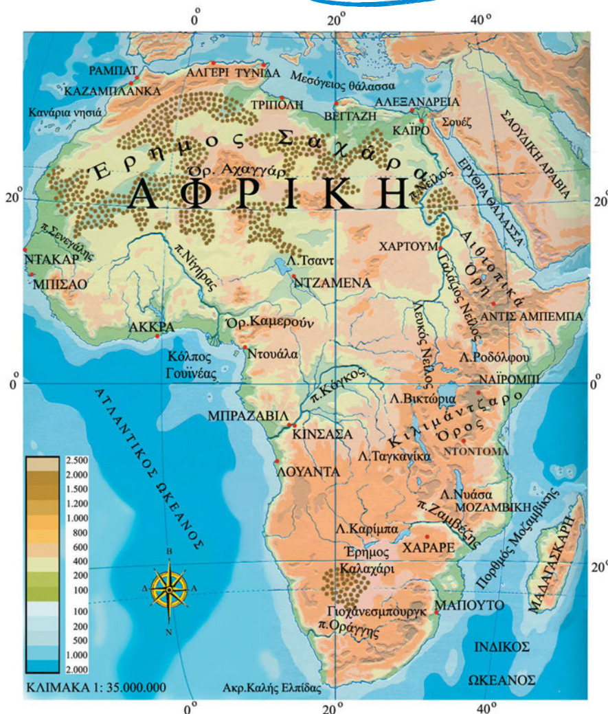
Εικόνα 37.1: Γεωμορφολογικός χάρτης της Αφρικής