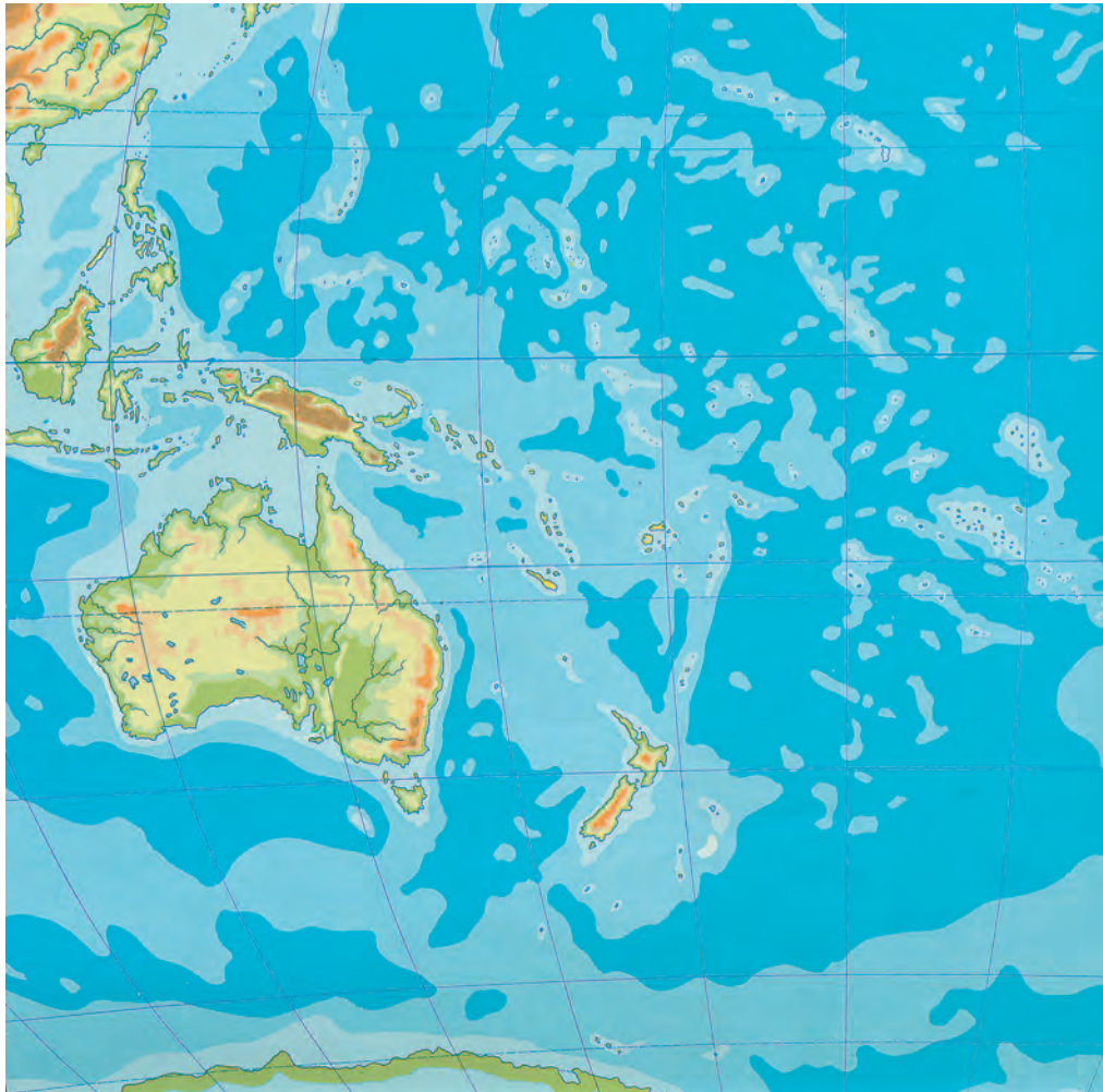
Εικόνα 44.1: Γεωμορφολογικός χάρτης της Ωκεανίας