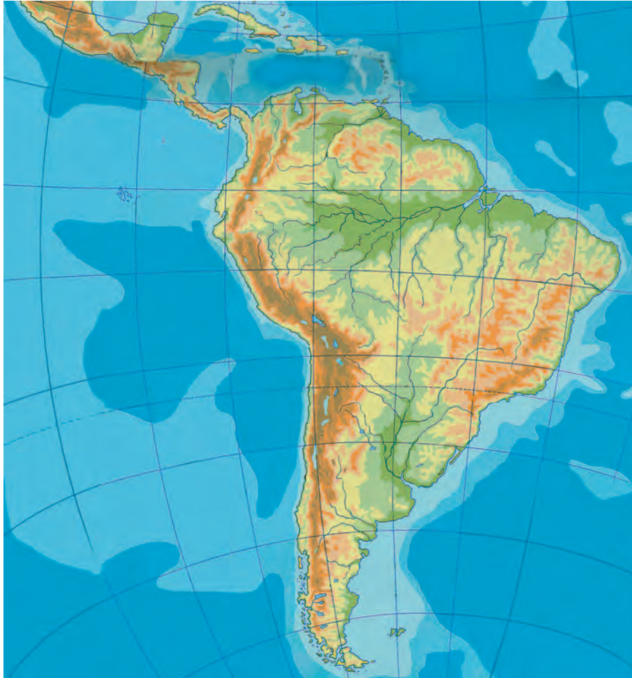
Εικόνα 42.1: Γεωμορφολογικός χάρτης της Ν. Αμερικής