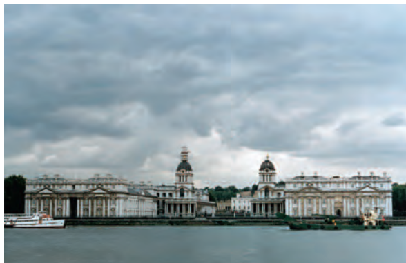
Εικόνα 23.1: Κοπεγχάγη