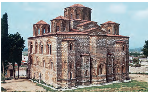
4. Στην Παναγία την Παρηγορίτισσα αφιέρωσαν τη Μητρόπολή τους, στην Άρτα, οι ιδρυτές του Δεσποτάτου της Ηπείρου.

Το ίδρυσε στην Ήπειρο ο δεσπότης Μιχαήλ Α΄ Άγγελος με πρωτεύουσά του την Άρτα . Με τον καιρό αύξησε την επικράτειά του σε όλη τη δυτική Ελλάδα και τη Μακεδονία. Η πιο σημαντική στιγμή της ιστορίας του όμως ήταν η απελευθέρωση της Θεσσαλονίκης, της δεύτερης σημαντικής πόλης της Αυτοκρατορίας, από τους Λατίνους, είκοσι χρόνια μετά την άλωσή της (1224).