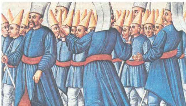
2.α. Τάγμα εκπαιδευομένων γενιτσάρων. (Βιέννη, Εθνική Βιβλιοθήκη)

«Στους κατακτημένους λαούς οι Οθωμανοί Τούρκοι επέβαλαν το παιδομάζωμα . Για να καλύψουν τις στρατιωτικές τους ανάγκες, καθώς έλεγαν, έπαιρναν, από μικρή ηλικία, τα δυνατά αρσενικά παιδιά των χριστιανών, τα έκαναν μουσουλμάνους, τα φανάτιζαν και τα εκπαίδευαν σε ειδικά στρατόπεδα στην τέχνη του πολέμου. Από αυτή τη βίαιη στρατολόγηση δημιούργησαν τα τάγματα των γενιτσάρων , που φημίζονταν για τη μαχητικότητά τους αλλά και για τη σκληρότητά τους κατά των αντιπάλων τους».