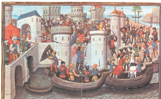
2. Η άλωση της Κωνσταντινούπολης από τους σταυροφόρους.

(Μικρογραφία χειρογράφου, Μουσείο Conté)