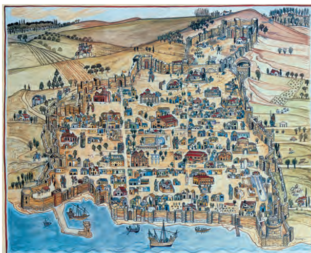
4. Η Θεσσαλονίκη στα βυζαντινά χρόνια. (Ζωγραφική αναπαράσταση Μ. Καμπάνη)