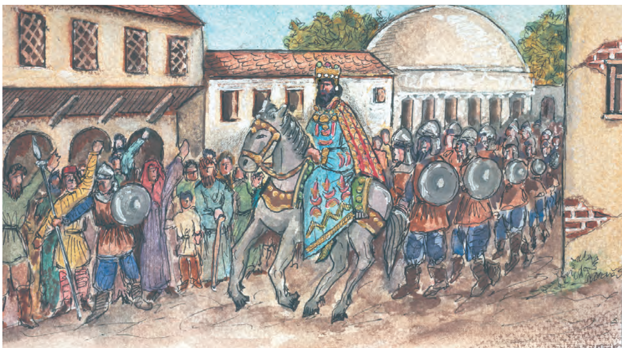
2. Οι κάτοικοι της Πόλης υποδέχτηκαν με ενθουσιασμό τον νέο αυτοκράτορα.