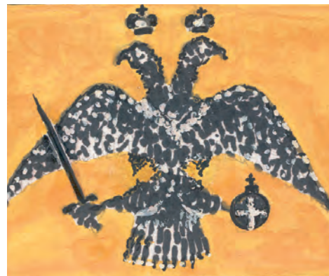
1. Ο δικέφαλος αετός έγινε το σύμβολο της εξόριστης αυτοκρατορίας.

Η ιστορία της αυτοκρατορίας της Νίκαιας είναι «η ιστορία της Πόλης χωρίς την Πόλη».