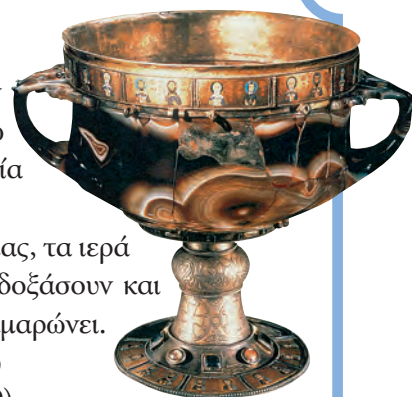
6. Πολύτιμο δισκοπότηρο από την Αγία Σοφία. Μεταφέρθηκε κι αυτό στη Βενετία.

Γαλέρες φεύγουν και γαλέρες έρχονται. Παίρνουν τα πλούτη μας, τη δόξα μας, τα ιερά μας. Αλλού τα πάνε στη Δύση, να ημερέψουν και κείνης τους λαούς, να δοξάσουν και κείνης τα χώματα. Η Βενετιά τα δέχεται περίχαρη, στολίζεται και καμαρώνει. Στήνει στις πλατείες της τ' άλογα τ' ανεμοπόδαρα, του ακράτητου λαού συμβολική παράσταση». 3 Ανδρέας Καρκαβίτσας, Λόγια της πλώρης (1899).