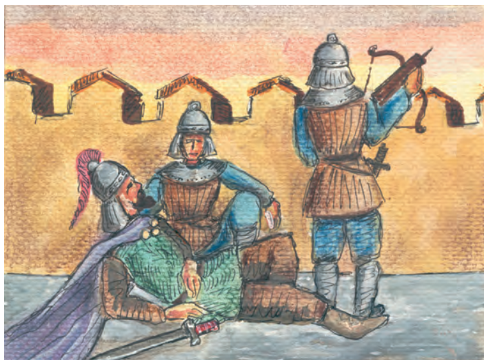
3. Ο Ιουστινιάνης πληγώνεται.

■ Τι μπορεί να συνέβη και να έμεινε ανοιχτή η Κερκόπορτα;