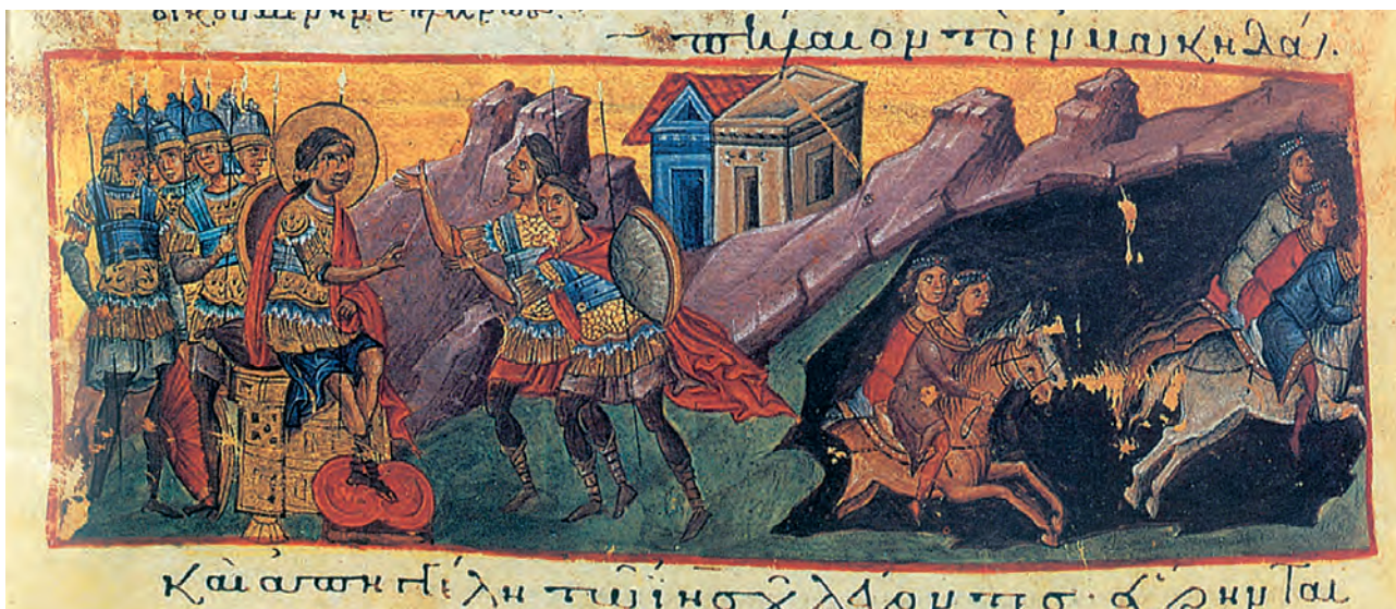
1. Βυζαντινοί φρουροί των συνόρων. Οι φρουρές αυτές στα χρόνια της παρακμής αποδιοργανώθηκαν. (μικρογραφία χειρογράφου, I.M. Βατοπεδίου, Άγιο Όρος)

Σε ιδιαίτερα δύσκολη θέση βρέθηκαν και οι κάτοικοι των ακριτικών περιοχών, που δεν μπο-