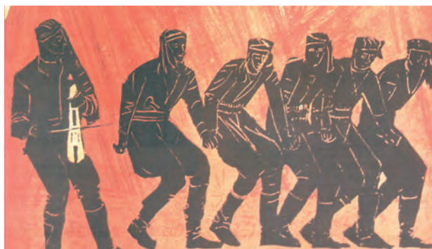
2. Πόντιοι χορευτές και λυράρης.

Στο διάστημα αυτό, αλλά και στα χρόνια της τουρκοκρατίας που ακολούθησαν, η Τραπεζούντα ήταν το χριστιανικό κέντρο των γύρω από τον Εύξεινο Πόντο ελληνικών πόλεων. Σ' αυτή έχει τις ρίζες του ο ποντιακός ελληνισμός και γι' αυτή μιλούν ακόμη οι παραδόσεις, οι χοροί και τα τραγούδια των Ποντίων.