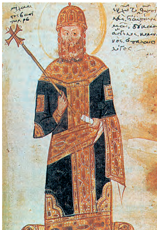
1. Ο Μιχαήλ Η΄, ο Παλαιολόγος, στέφθηκε αυτοκράτορας και στην Αγία Σοφία.

Η ανάκτηση της Πόλης όμως δεν έλυσε τα προβλήματα που υπήρχαν ούτε τα νέα που είχαν δημιουργηθεί. Η Κωνσταντινούπολη έμεινε χωρίς συμμάχους και οι εχθροί τώρα ήταν πολλοί. Στην Ανατολή παραμόνευαν νέα και πιο επικίνδυνα τουρκικά φύλα, στον Βορρά απειλούσαν οι Σέρβοι και οι Βούλγαροι, στη Δύση οι Φράγκοι και οι Βενετοί. Όλα φανέρωναν ότι η αυτοκρατορία εξέπεμπε τις τελευταίες αναλαμπές της, λίγο πριν την τελική της πτώση.