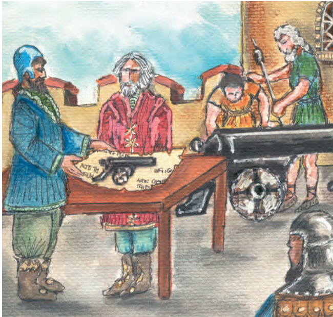
4. Ο Ούγγρος μηχανικός Ουρβανός ανέλαβε την κατασκευή κανονιών για την πολιορκία της Πόλης.