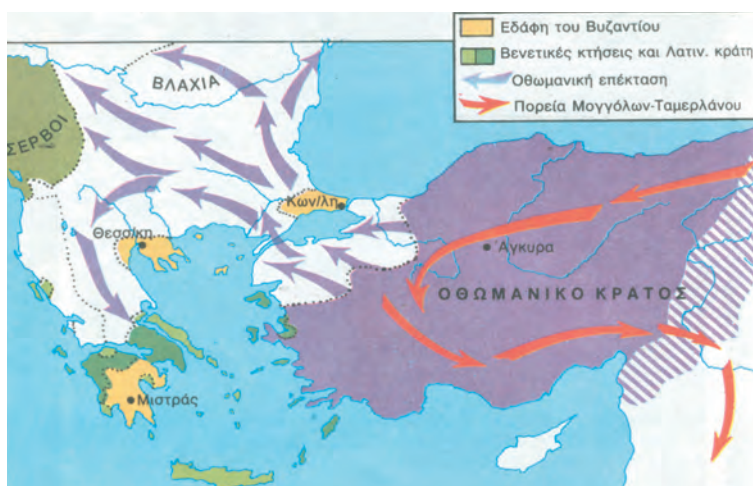
1. Χάρτης της οθωμανικής επέκτασης και της πορείας των Μογγόλων.

Για είκοσι χρόνια οι Τούρκοι δεν ενόχλησαν ξανά το Βυζάντιο. Το 1421 όμως έγινε σουλτάνος ο Μουράτ Β΄ . Φιλόδοξος και ορμητικός καθώς ήταν, ήθελε να συνεχίσει το έργο που δεν ολοκλήρωσε ο Βαγιαζήτ. Γι' αυτό οργάνωσε τον στρατό του και τον επόμενο χρόνο