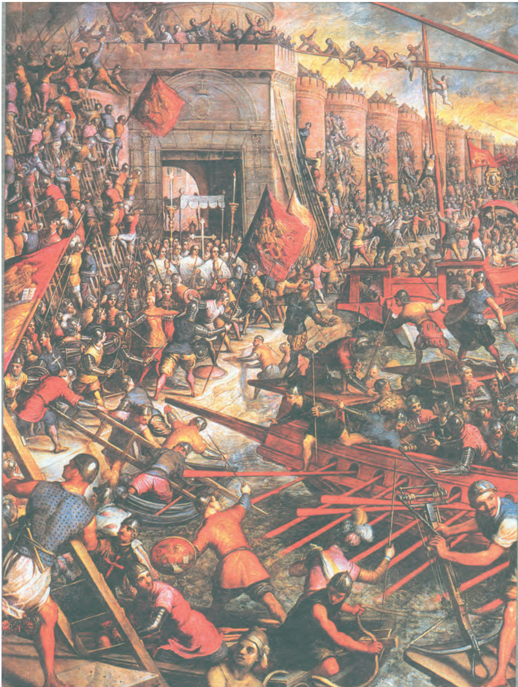
Η άλωση της Κωνσταντινούπολης από τους σταυροφόρους (1204 μ.Χ.). (Τοιχογραφία από την αίθουσα του Μεγάλου Συμβουλίου, στο Ανάκτορο των Δόγηδων, Βενετία)