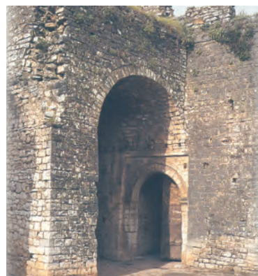
3.α. Τμήμα του κάστρου των Ιωαννίνων, όπως είναι σήμερα.