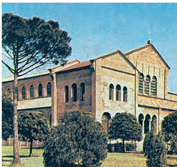
2. Ο ναός του Αγίου Δημητρίου στη Θεσσαλονίκη.