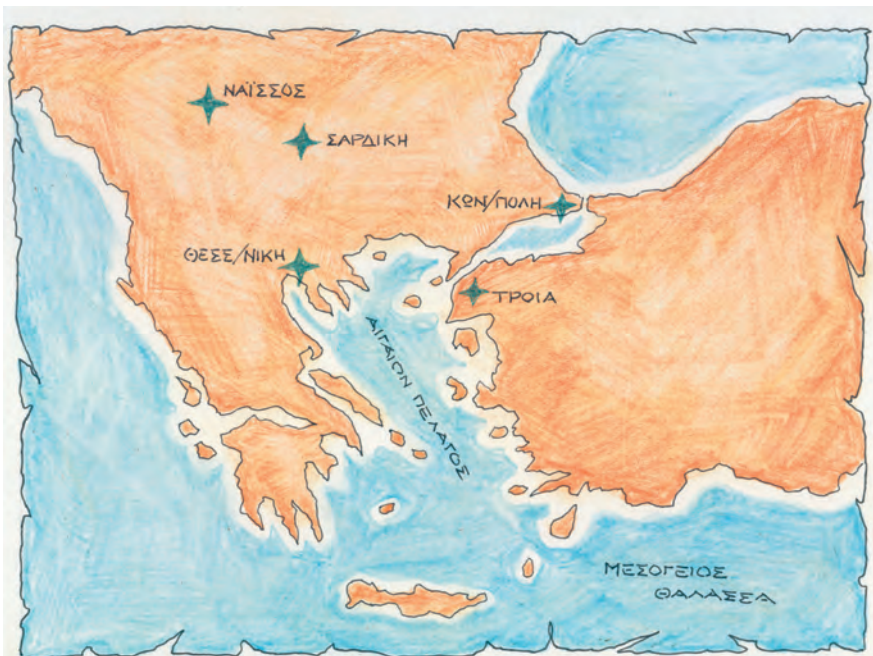
1. Χάρτης με τις πόλεις που ο Κωνσταντίνος είχε διαλέξει για να μεταφέρει την πρωτεύουσα της Ρωμαϊκής Αυτοκρατορίας.

Στα χρόνια παρακμής της αυτοκρατορίας (13ος-