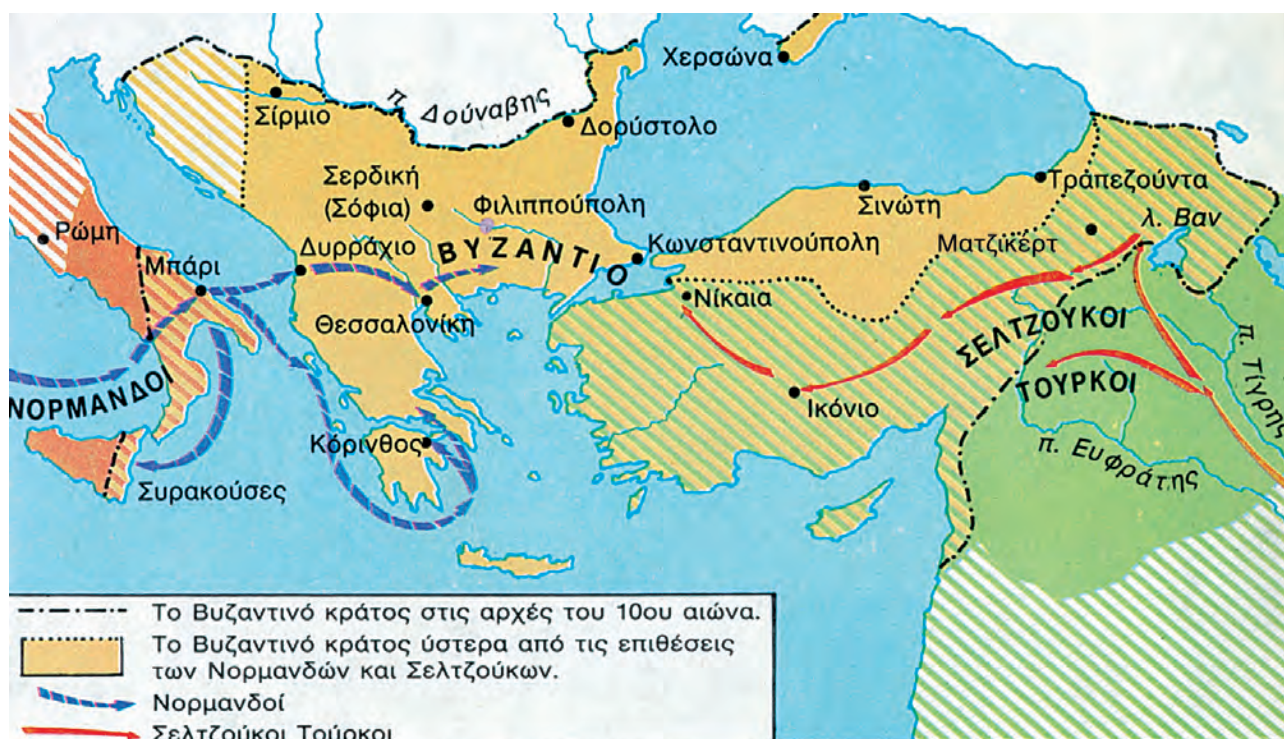
2. Οι Τούρκοι και οι Νορμανδοί απειλούν την αυτοκρατορία από την Ανατολή και τη Δύση.