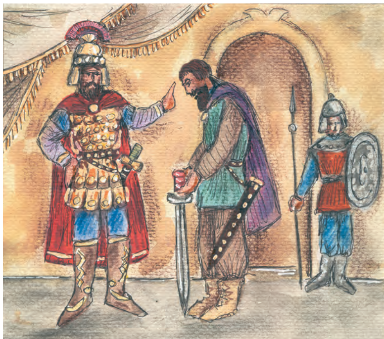
3. Ο αυτοκράτορας ανέθεσε στον Ιουστινιάνη την οργάνωση της άμυνας της Πόλης.