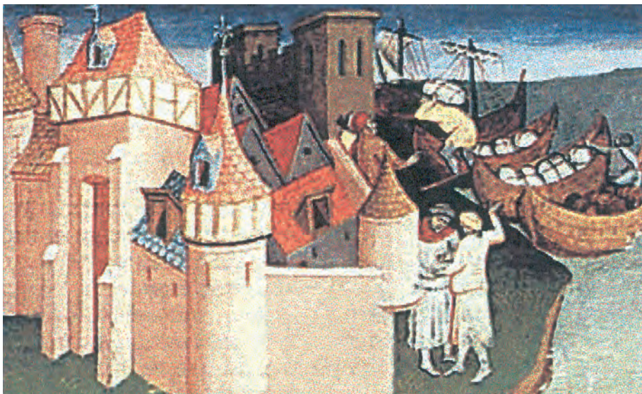
3. Βενετοί έμποροι στο λιμάνι του Γαλατά. (Μικρογραφία χειρογράφου, Εθνική Βιβλιοθήκη, Παρίσι)