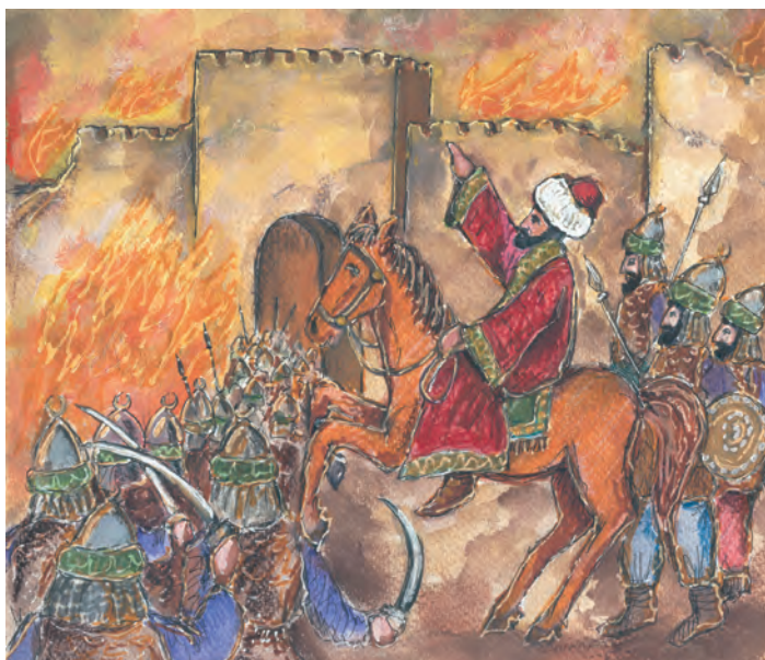
2. Ο Μωάμεθ έξω από την Κωνσταντινούπολη.