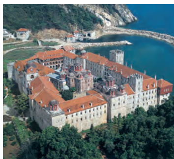
6.α. Άγιο Όρος, Ιερά Μονή Εσφιγμένου.

Στη διάρκεια της εικονομαχίας πολλοί διωκόμενοι εικονολάτρες κατέφυγαν στο όρος Άθως της Χαλκιδικής, παίρνοντας μαζί τους ιερά λείψανα, εικόνες, χειρόγραφα και σκεύη των εκκλησιών, για να τα περισώσουν. Εκεί, αρχικά, ζούσαν σε σπηλιές και σε σκήτες 3 «μελετώντας και διαλογιζόμενοι».