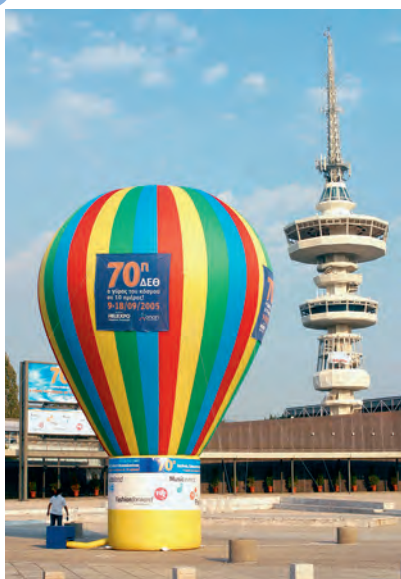
5.α. Η Θεσσαλονίκη τις μέρες της Διεθνούς Έκθεσης.