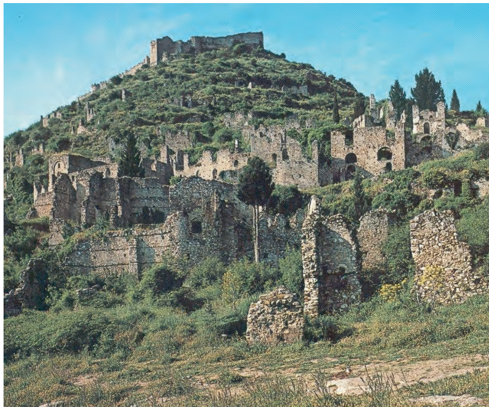
5. Ο Μιστράς όπως σώζεται σήμερα.

Τα κάστρα, τα παλάτια και οι εκκλησίες του σώζονται ως σήμερα και δίνουν ανάγλυφη την εικόνα της βυζαντινής αυτής πολιτείας.