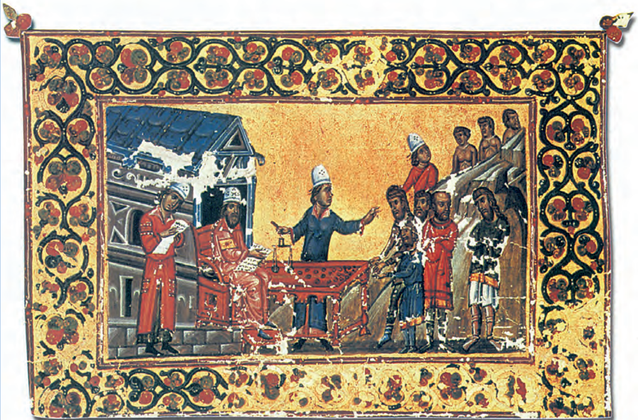
4.a. Βυζαντινός φορολόγος εισπράττει χρήματα από τους οφειλότες. (Μικρογραφία από βυζαντινό χειρόγραφο, Ι. Μ. Αγ. Αικατερίνης, Σινά)