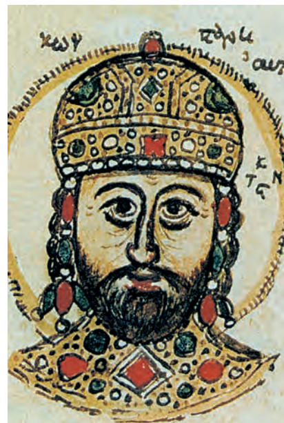
7.α. Κωνσταντίνος Παλαιολόγος. (Βυζαντινή μικρογραφία, βιβλιοθήκη Estense, Μόντενα)

Ελληνικά δημοτικά τραγούδια. Ακαδημία Αθηνών, Εκλογή.