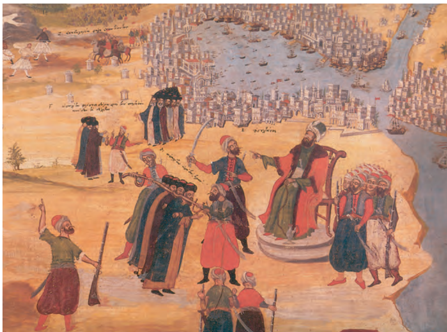
2. Η πολιορκία της Κωνσταντινουπόλης. (Σκέψις Μακρυγιάννη, πίνακας Π. Ζωγράφου, 1836)

Στις 20 Απριλίου, ξημερώματα, οι ελπίδες των αποκλεισμένων ζωντανεύουν. Τρία μεγάλα γενοβέζικα καράβια και μια βυζαντινή φορτηγίδα με κυβερνήτη τον Φλαντανελά, περνούν απαρατήρητα τα στενά, φτάνουν στην Προποντίδα και κατευθύνονται στον Κεράτιο, φορτωμένα σιτάρι, εφόδια και πολεμιστές. Οι Τούρκοι ξαφνιάζονται και ρίχνονται πάνω τους να τα προλάβουν πριν περάσουν την αλυσίδα. Στη σκληρή ναυμαχία που ακολούθησε, τα χριστιανικά καράβια νίκησαν και μπήκαν στον ελεύθερο ακόμη Κεράτιο. Το γεγονός αυτό εμπύχωσε τους πολιορκημένους, που δέχτηκαν σαν ήρωες τους νικητές. Εξόργισε όμως τον Μωάμεθ, που τιμώρησε σκληρά τον ναύαρχό του και πήρε νέα μέτρα, πιο σκληρά, για την πολιορκία και την άλωση της Πόλης.