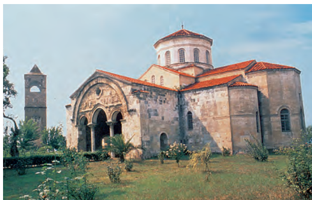
3. Ο ναός της Αγίας Σοφίας στην Τραπεζούντα. Οι ιδρυτές του νέου κρατιδίου μετέφεραν εδώ τις μνήμες και το όνομα της Μεγάλης Εκκλησίας.