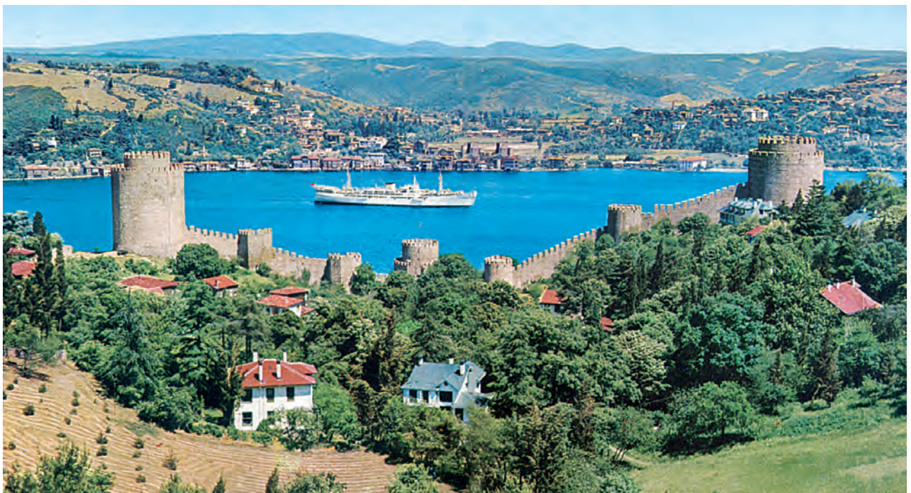
6. Ο Μωάμεθ έχτισε στον Βόσπορο ένα φρούριο, το Ρούμελη Χισάρ, για να ελέγχει τα πλοία που πήγαιναν προς την Κωνσταντινούπολη.

Δούκας (ιστορικός της Άλωσης) (ελεύθερη απόδοση, Ν. Καζαντζάκης).