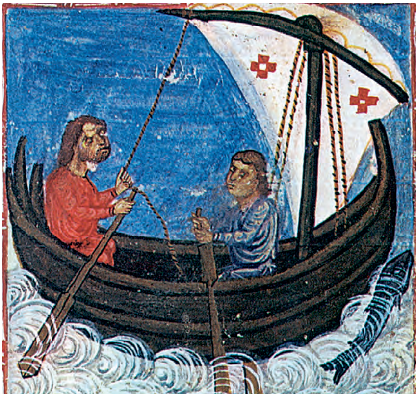
2. Τα βυζαντινά κάραβια σταμάτησαν το εμπόριο, μετά την παραχώρηση προνομίων στους Βενετούς. (Μικρογραφία, Πατριαρχική βιβλιοθήκη Ιεροσολύμων)