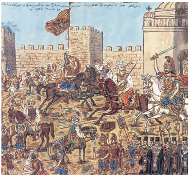
5.α. Η Άλωση της Πόλης. (Πίνακας του λαϊκού ζωγράφου Θεόφιλου, 1930)