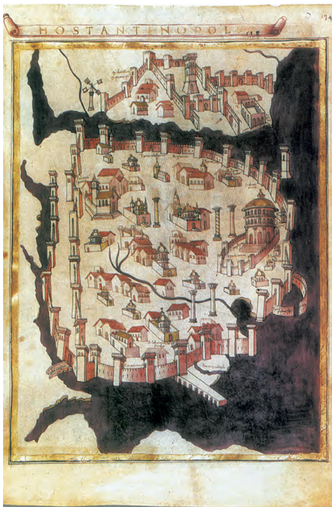
2. Σχέδιο της Κωνσταντινούπολης κατά τον 15ο αιώνα. Διακρίνονται τα τείχη, ο Κεράτιος κόλπος και ο Γαλατάς, όπου είχαν εγκατασταθεί Βενετοί και Γενουάτες. (Φλωρεντία, Λαυρεντιανή Βιβλιοθήκη)