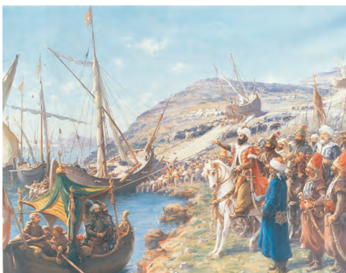
1. Ο Μωάμεθ παρακολουθεί το πέρασμα των караβιών στον Κεράτιο από τη στεριά. (Πίνακας του Φαούστο Ζονάρο, Κωνσταντινούπολη, Παλάτι Ντολμαμαχτσέ, 1908)

Ο διάλογος αυτός ήταν και ο τελευταίος ανάμεσα στους δυο αντιπάλους. Ο κλοιός των πολιορκητών στένεψε. «Ούτε πουλί πετούμενο δεν μπορούσε πια να μπει στην Πόλη» . Ξημερώματα της 29ης Μαΐου, ημέρα Τρίτη, άρχισε η μεγάλη επίθεση. Τις ομοβροντίες των κανονιών σκεπάζει ο αχός του πιο μεγάλου από αυτά, της μπομπάρδας, που χτυπά και ραγίζει τον πύργο του Αγίου Ρωμανού. Χιλιάδες πολιορκητές ορμούν στα τείχη, στα λαγούμια και στη βαθιά τάφρο, αψηφώντας τον θά-