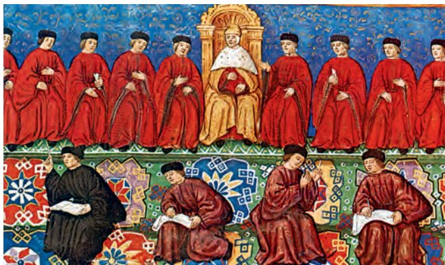
1. Το συμβούλιο διακυβέρνησης της Βενετίας.

Στην τέταρτη σταυροφορία, οι σταυροφόροι 2 συγκεντρώθηκαν στη Βενετία . Απόφασή τους ήταν να περάσουν με πλοία στην Αίγυπτο και μετά να κατευθυνθούν στην Αγία Πόλη, τα Ιεροσόλυμα. Οι Βενετοί διέθεσαν τα καράβια τους μαζί με τα πληρώματά τους. Ως αντάλλαγμα θα έπαιρναν τα μισά από τα εδάφη και τα λάφυρα που θα κατακτούσαν.