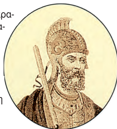
1. Ρωμανός Δ΄ Διογένης.

Το 1068 αυτοκράτορας του Βυζαντίου έγινε ο Ρωμανός Δ΄, ο Διογένης . Καταγόταν από την Καππαδοκία και διακρινόταν για το ήθος και τη γενναιότητά του. Παρά τις οικονομικές δυσκολίες που αντιμετώπιζε, οργάνωσε ένα αξιόμαχο εκστρατευτικό σώμα και, οδηγώντας το ο ίδιος, έσπευσε να αντιμετωπίσει τους Σελτζούκους.