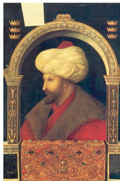
1. Ο Μωάμεθ Β΄.

Την αρνητική απάντηση ακολούθησε καταιγίδα κανονιοβολισμών. Οι πολιορκητές ξεχύνονται προς τα τείχη. Στήνουν ξύλινους πύργους, σκάβουν λαγούμια 2 κάτω από τα