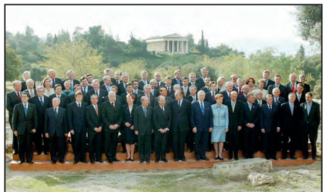
2003: Η Κύπρος γίνεται μέλος της Ε.Ε.