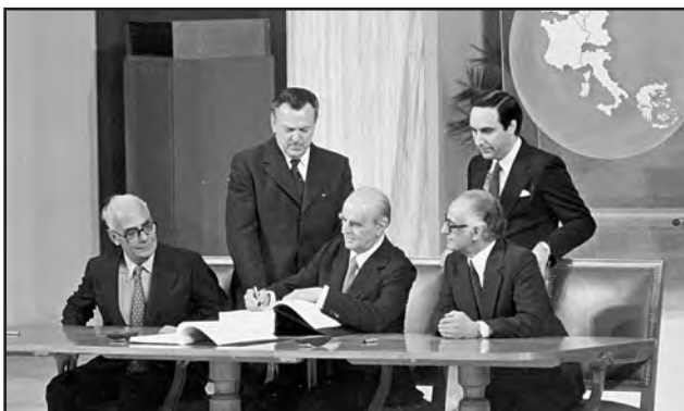
1980: Η Ελλάδα εντάσσεται στην Ε.Ο.Κ.