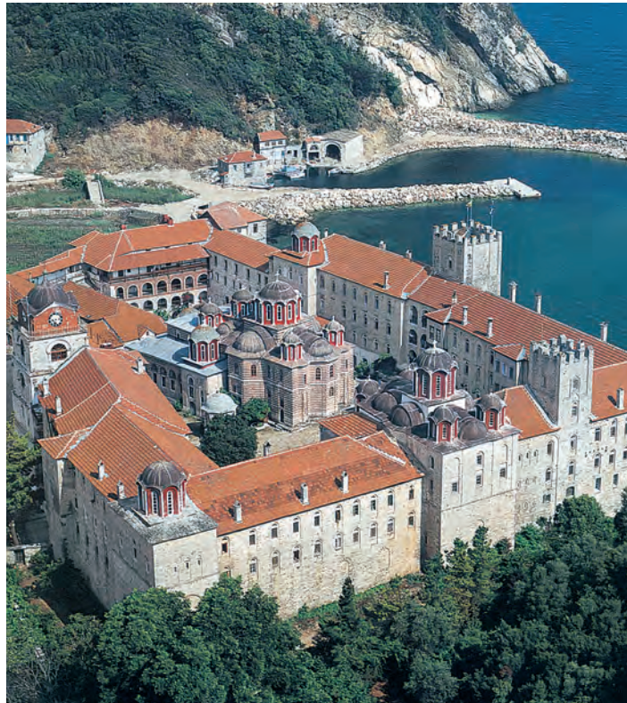
Μονή Εσφιγμένου, Άγιον Όρος