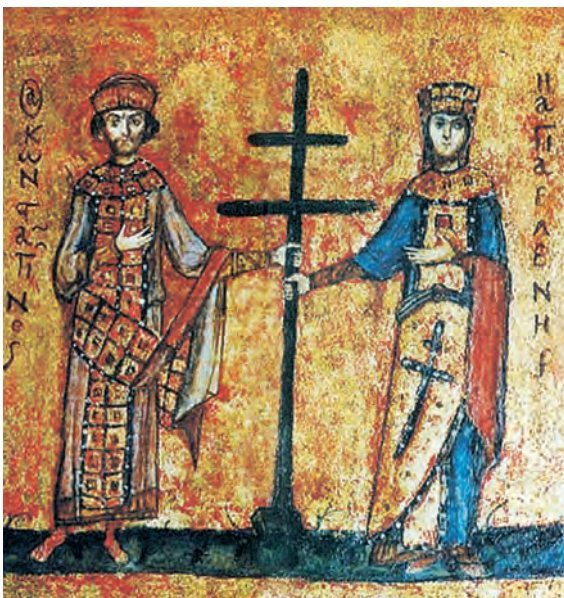
Οι άγιοι Κωνσταντίνος και Ελένη

5. Διαβάστε το παρακάτω κείμενο-πηγή, παρατηρήστε την εικόνα και συζητήστε αν (κατά τη γνώμη σας) η μητέρα του Κωνσταντίνου, που ήταν Ελληνίδα και χριστιανή, έπαιξε κάποιο ρόλο στις σημαντικές αποφάσεις που αυτός πήρε και σε ποιες.