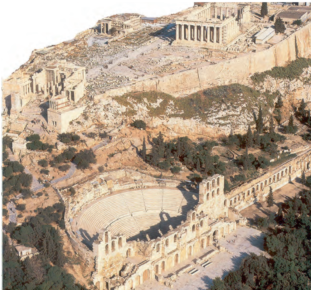
Το ρωμαϊκό Ωδείο Ηρώδη του Αττικού, κάτω από την Ακρόπολη