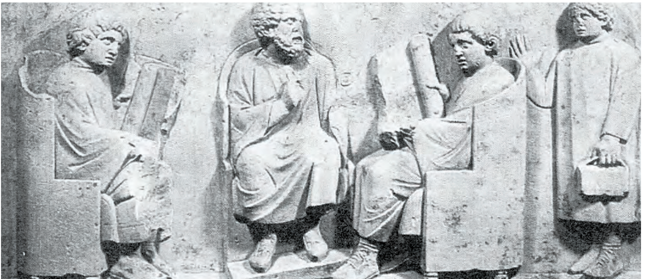
Δάσκαλος και μαθητές σε ώρα μαθήματος. ( Ανάγλυφο, Trier, Μουσείο Ρήνου )

Τα Ρωμαίοπουλα μάθαιναν γράμματα από δασκάλους δούλους των οικογενειών τους ή από ελεύθερους που είχαν δικά τους σχολεία. Διδάσκονταν ανάγνωση, γραφή, γραμματική, αριθμητική, ιστορία και υπακοή. Οι μαθητές υπάκουαν στις συμβουλές ή τις εντολές των δασκάλων τους τόσο, ώστε «οι λέξεις μαθητής και πειθαρχία ήταν σχεδόν συνώνυμες».