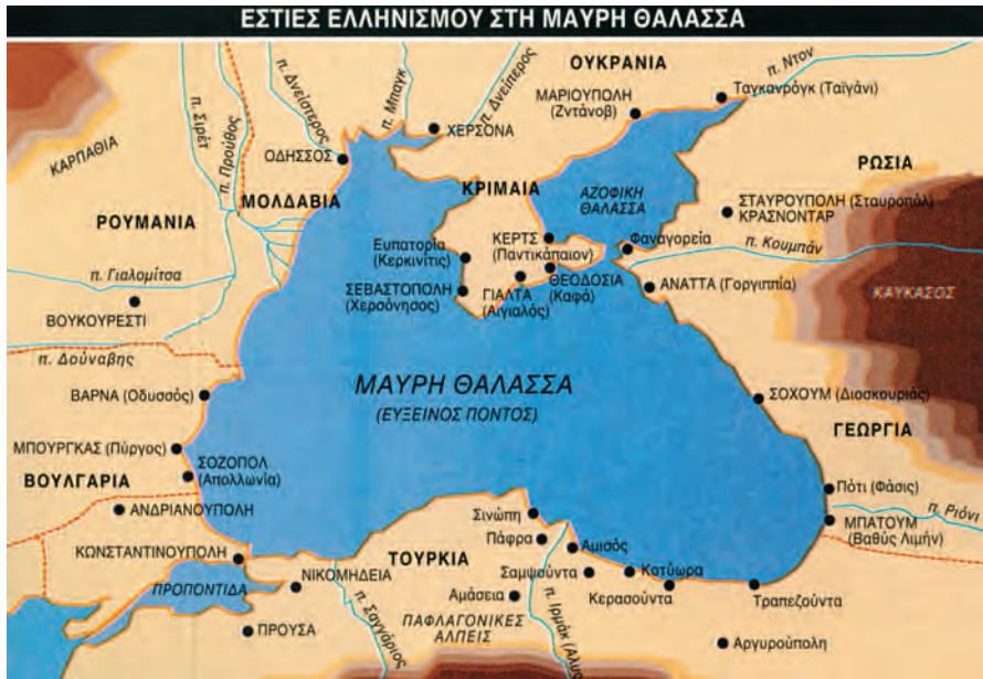
Εικόνα 47.1: Εστίες Ελληνισμού στη Μαύρη Θάλασσα